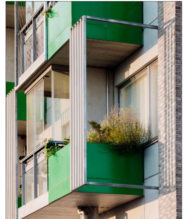
(1) Tutkimuksessa mukana olevat kaupungit: Espoo, Hamina, Helsinki, Hämeenlinna, Joensuu, Jyväskylä, Kajaani, Kotka, Kouvola, Kuopio, Lahti, Lappeenranta, Lohja, Oulu, Pori, Salo, Seinäjoki, Tampere, Turku, Vaasa, Vantaa. Lisäksi 200 hlö otos ulkopuolisilta alueilta.

Tutkimus tuotti tietoa kaupunkilaisten asumismielityksistä ja tunnisti erilaisia asukasprofieja. Tässä policy briefissä esitetään tutkimuksen keskeisiä tuloksia.